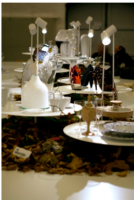
Obrázek 2: „Stolečku, prostři se.“ na Blickfangu v Kodani.