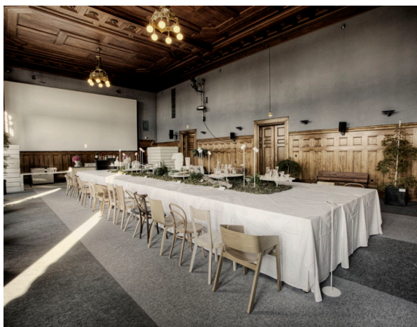
Obrázek 1: Pohled na instalaci „Stolečku, prostři se.“ ve vídeňském MAK muzeu.